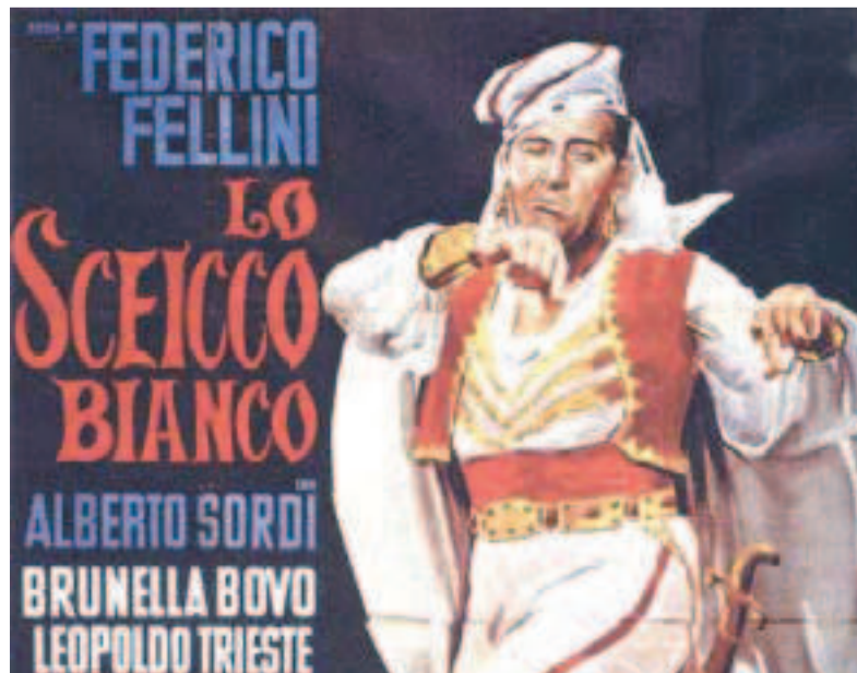
La locandina del film "Lo sceicco bianco"

Quanto a distinzioni tra buone e cattive sceneggiature? «Da come si legge: le buone sceneggiature sono facili e coinvolgenti; quelle cattive richiedono uno sforzo disperato».