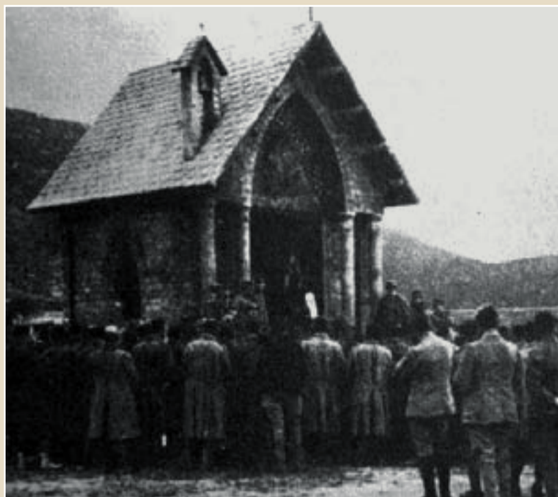
Sopra, una cerimonia religiosa davanti a una cappella (oggi scomparsa) costruita dagli stessi prigionieri austroungarici sull'Asinara. A sinistra, un barcone per il trasporto dei soldati austriaci dalle navi al molo di Cala Reale