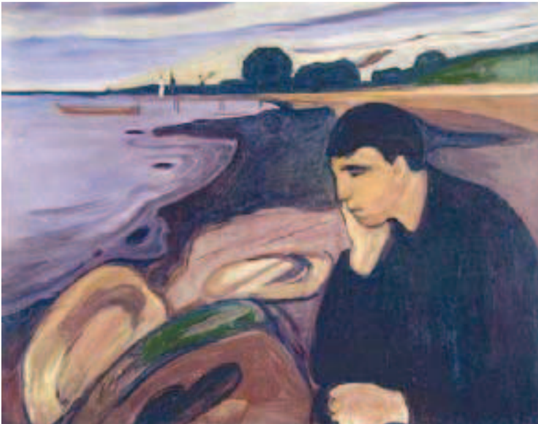
Edvard Munch, Malinconia, 1894-1896

All'artista che catapultò la Norvegia nelle alte sfere della cultura europea di fine '800 e che aprì la strada all'Espressionismo tedesco degli inizi del '900, Linea d'ombra di Treviso ha dedicato una grande mostra a Villa Manin di Passariano di Codroipo che resterà aperta fino al 6 marzo 2011. Munch e lo spirito del Nord (aperto il 1° gennaio, ingresso 10 euro, ridotto 8; info tel. 0422/429999) presenta 35